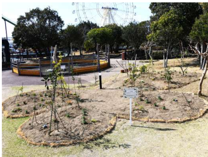
チョウのファミリーレストラン

3月25日（土）・26日（日）JT生命誌研究館の昆虫学者によるレクチャーイベントを開催